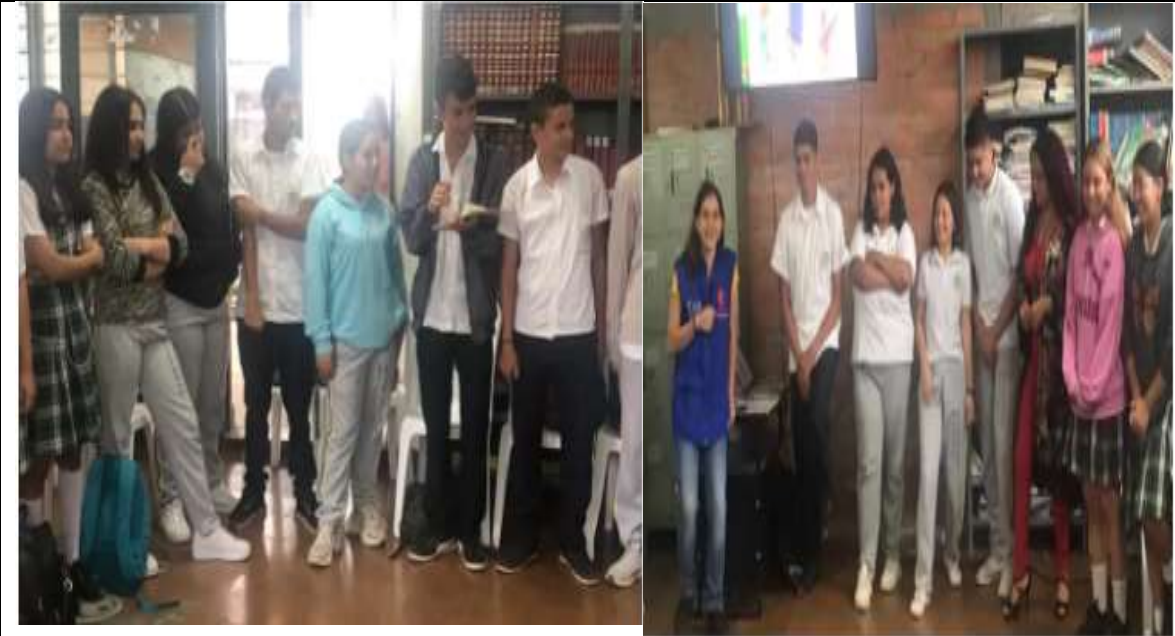
Actividad: Taller formadores de lectura. Proyecto PILEOZ Lugar: Sede central