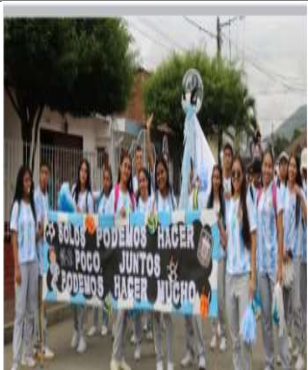
Actividad: Desarrollo de la semana deportiva Lugar: Sede central