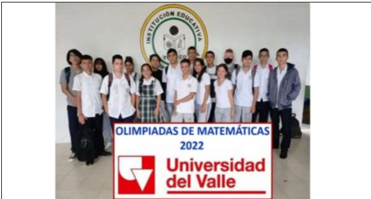
Actividad: Olimpiadas de Matemáticas. Lugar: Sede central