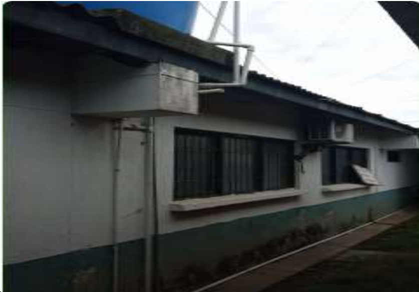
Actividad: arreglo e instalación de nueva acometida de agua Lugar: sede Jorge Eliecer Gaitán