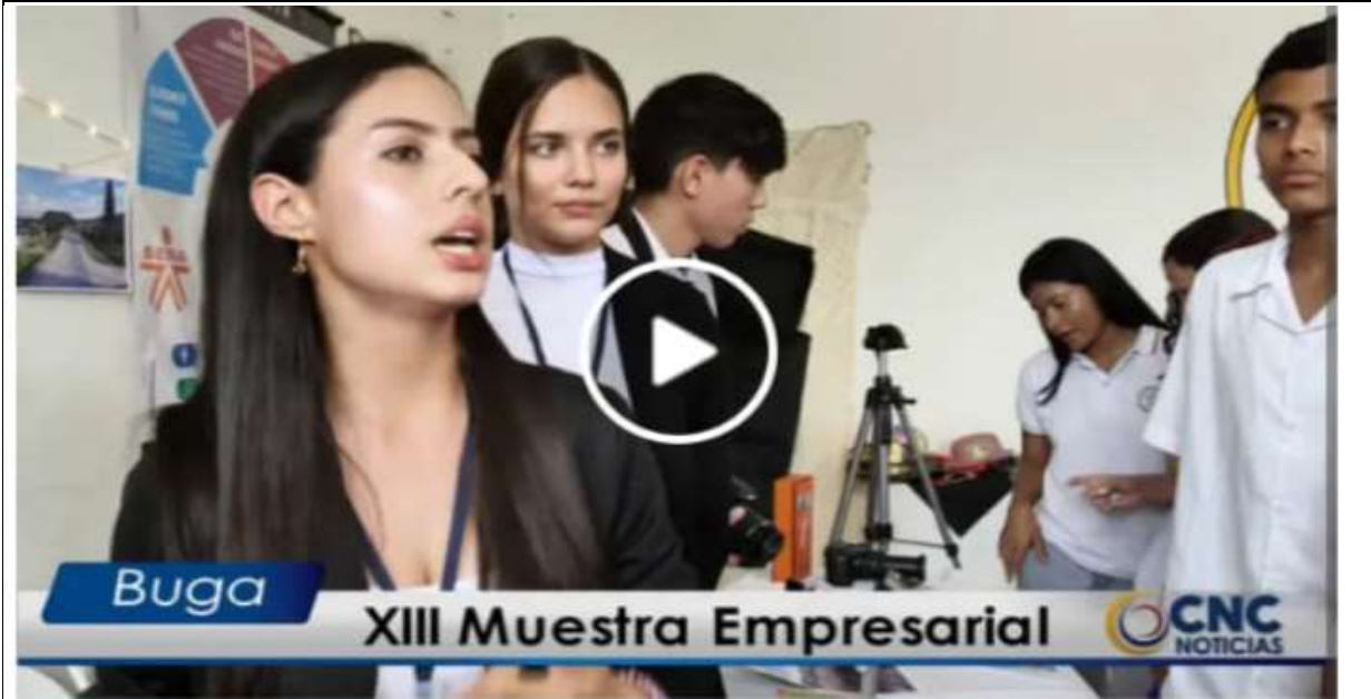
Actividad: XIII Muestra Empresarial 2022 Lugar: Sede central