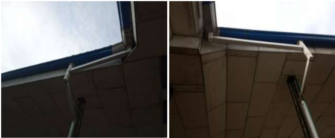
Actividad: adecuación y mantenimiento de canales aguas lluvias Lugar: sede Central